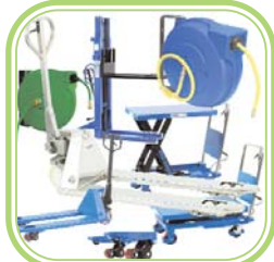
Lager- u. Betriebseinrichtung