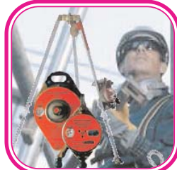
PSA gegen Absturz